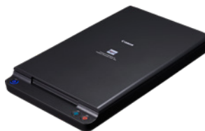
A4 Flatbed Scanner Unit 102

Esegui la scansione di libri rilegati, diari e documenti fragili aggiungendo l'unità scanner a piano fisso 102 per documenti fino al formato A4 oppure l'unità scanner a piano fisso 201 per documenti di formato A3. Collegati tramite USB, questi scanner a piano fisso funzionano perfettamente con il modello DR-C225 II (solo) e consentono di eseguire scansioni fronte-retro senza problemi e di applicare le stesse funzioni di miglioramento delle immagini a qualsiasi scansione.